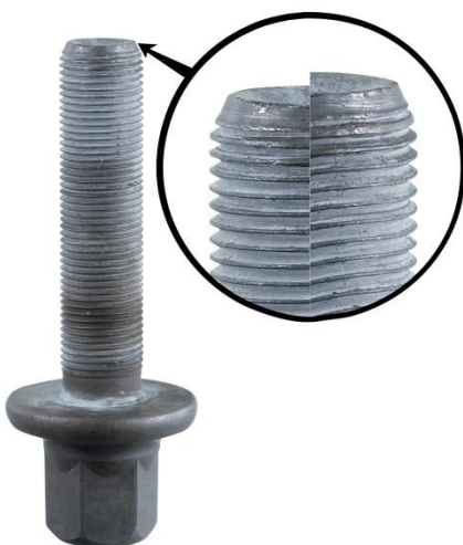
Vervorming van de bout

De afmeting van een nieuwe bevestigingsbout is M18 x 1,5 met een maximale lengte van 85,5 mm . Het is belangrijk om met deze bout een borgschijf te gebruiken. Tijdens het aandraaien met een moment en vervolgens over een hoek wordt de bout vervormd en uitgerekt. Daarom is het raadzaam om een nieuwe bout te gebruiken bij de montage of hermontage van een demperpoelie. Anders is de demperpoelie mogelijk niet correct bevestigd, waardoor hij op de as gaat ronddraaien.