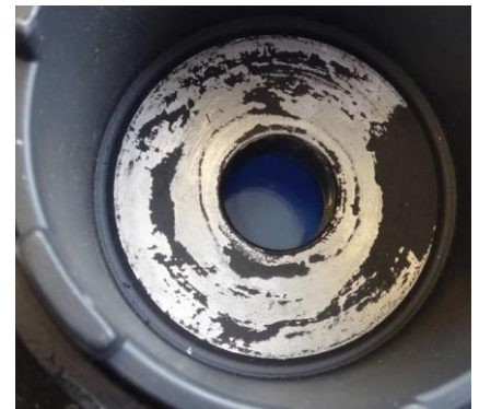
Afsplinteringen op het voorste contactvlak van de demperpoelie wijzen op een incorrect aangedraaide bevestigingsbout.

Als de bevestigingsbout niet correct is aangedraaid, kan de demperpoelie beginnen trillen en eventueel lawaai produceren.