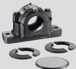
Soporte de zócalo SNC + 2 juntas DS de doble labio + obturador