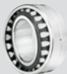
ULTAGE Rodamiento a rótula sobre rodillos, abierto, agujero cónico