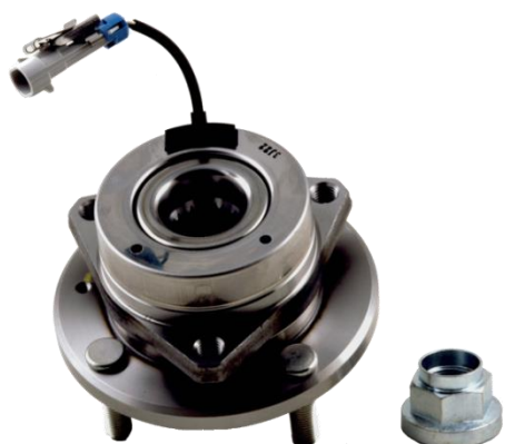
ОЕ номер 96639585

Візуальний огляд необхідний, щоб визначити модель підшипника, яка використовується на даному транспортному засобі: підшипникові з металевою кришкою відповідає комплект R190.06.