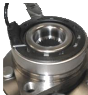
ОЕ номер 96812719