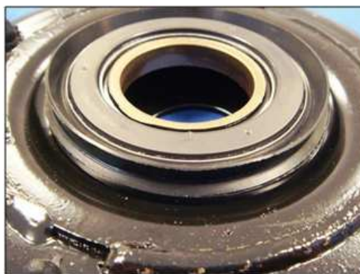
Встановлення ущільнення на опору

Дотримуйтесь напрямку встановлення ущільнення: ущільнююча крайка повинна бути спрямована до гумової опори