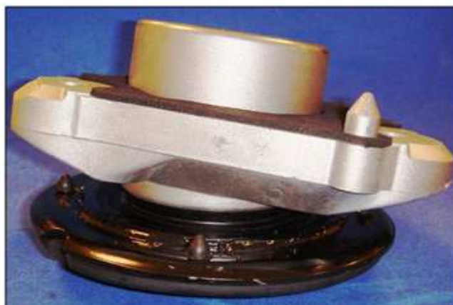
Зовнішній вигляд остаточного складання