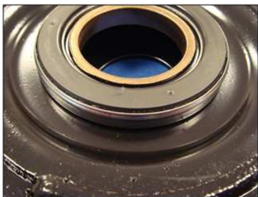
Правильне встановлення опори стійки

Дотримуйтесь напрямку встановлення підшипника опори: металевий бік не повинен бути видимим