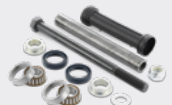
KITS DE BRAZO DE SUSPENSIÓN KS 5

Elegir la oferta SNR es elegir la calidad y la eficiencia.